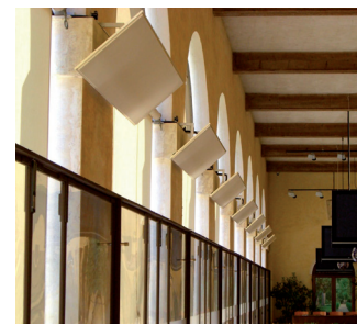
Esempio | Example

I Pannelli Radianti per Soffitto sono adattabili a qualsiasi situazione (integrati nei pannelli del contro-soffitto, fissati a soffitto, sospesi ad una determinata altezza, ecc...), sono smontabili e recuperabili con estrema facilità. Sono ideali per riscaldare specifiche zone o posti di lavoro in un singolo ambiente ad esempio officine, magazzini, laboratori, chioschi o porticati di ambienti pubblici come bar, ristoranti, ecc... .