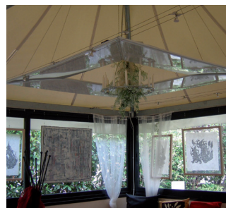
Esempio | Example