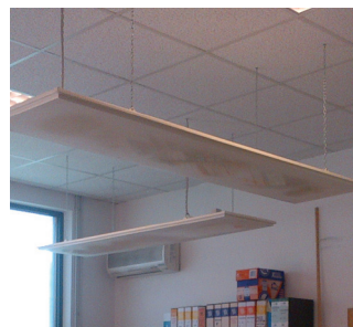
Esempio | Example