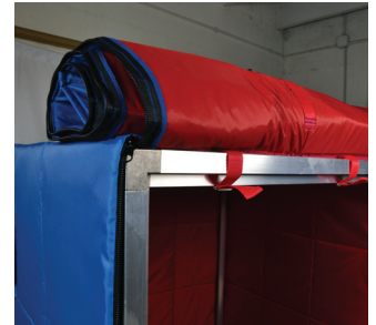
Sistema chiusura box Box closure system

Le camere calde ISOIND per fusti e cisterne vengono utilizzate per evitare che le sostanze al loro interno gelino o addensino. Il box riscaldato e' composto da due pedane modulari riscaldanti, un telaio in alluminio e una protezione termica per creare un volume chiuso. Il sistema e' molto semplice e riduce gli investimenti.