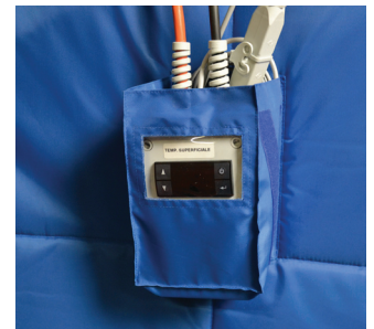
Centralina elettronica Electronic controller